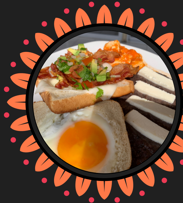
HUEVOS A LA MINUTA $93