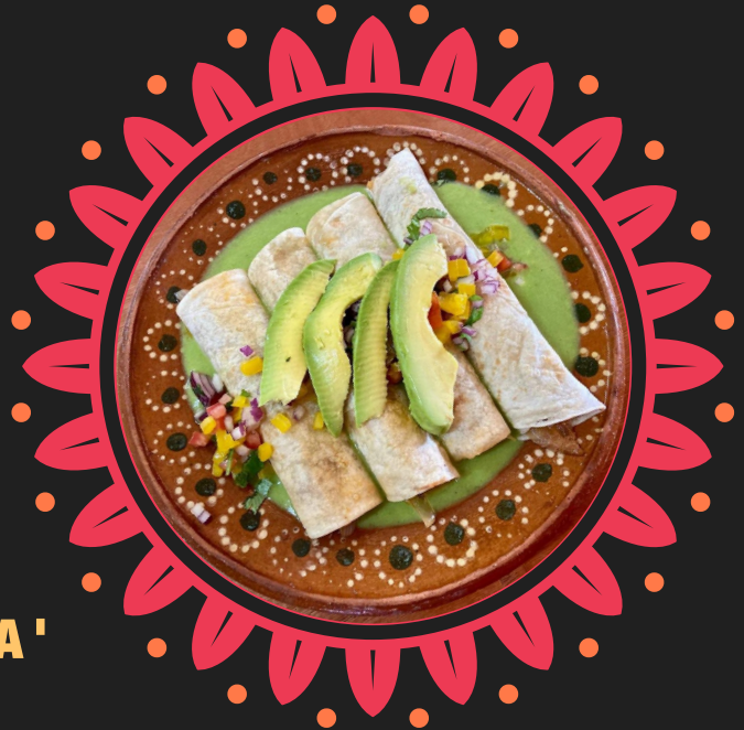
LOS TACOS DE MI APA' $115