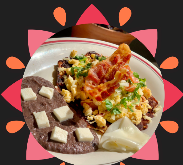
TOSTADA DE QUESO $83